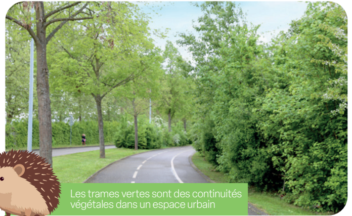
Les trames vertes sont des continuités végétales dans un espace urbain

Présentes dans notre ville (rue Albert Schweitzer, rue des Vignes, rue du 23 Novembre), elles se renforcent chaque année avec le remplacement d'espaces engazonnés et du patrimoine arboré par des végétaux plus adaptés au changement climatique (4 000 arbres et jeunes plants plantés depuis 2020, notamment au cimetière Baggersee, au Forum de l'ill, aux abords de l'Arena, au parc d'Innovation et dans les écoles). Les habitants ont été associés à ces démarches lors de plantations participatives . Tous ces lieux végétalisés participent au renforcement des trames vertes dans notre ville. Sans parler du jardin pédagogique, qui, en plus d'offrir de la verdure, permet aux enfants d'observer la nature.