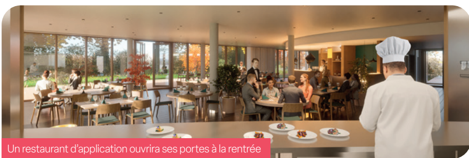
Un restaurant d'application ouvrira ses portes à la rentrée

L'équipe d'encadrement et d'enseignement, soit 40 personnes, peut être fière de ses apprentis qui chaque année, portent haut les couleurs de la ville lors de concours,