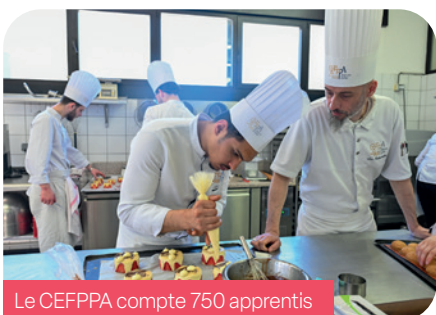
Le CEFPPA compte 750 apprentis