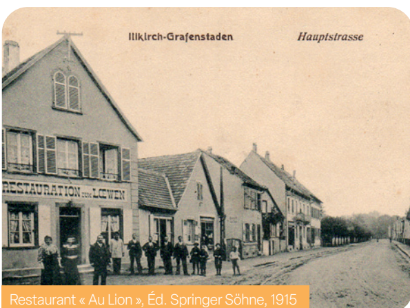
Restaurant « Au Lion », Éd. Springer Söhne, 1915

Des animations sont prévues ainsi qu'un barbecue, venez nombreux !