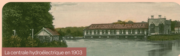
La centrale hydroélectrique en 1903

120 Jahr später isch's Kräfwärrik immer noch in Betrieb. Es het sich mit sim kùmm sischtbàre Dàm in de Ùmgejed guet ingegliedert.