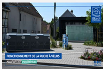
Fonctionnement de la ruche à vélos