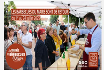
Les barbecues du Maire sont de retour !