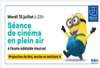
Séance de cinéma en plein air