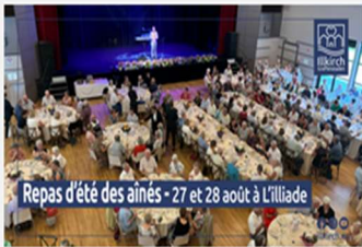
Repas d'été des Aînés – Inscriptions