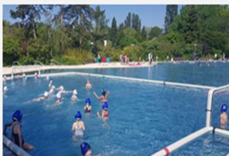
Nager Nature 2025 : des ateliers gratuits pour apprendre à nager