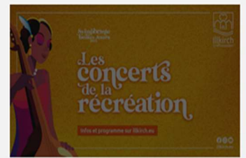
Les concerts de la récréation