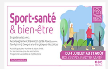
Sport-santé & bien-être