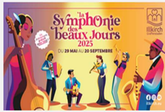
La Symphonie des Beaux Jours