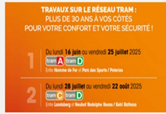
Travaux sur le réseau tram du 16 juin au 22 août 2025