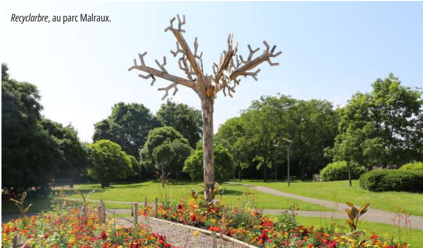
Recyclarbre, au parc Malraux.

Cette année, le fleurissement de la commune a été placé sous le signe de l'arbre (lire Infograff de juin). Le thème, « Terre d'arbres ! », est notamment développé par onze mises en scène visibles à travers la ville. Celles-ci sont dotées de pupitres explicatifs, illustrés par la graphiste illkirchoise Aurélie Meyer.