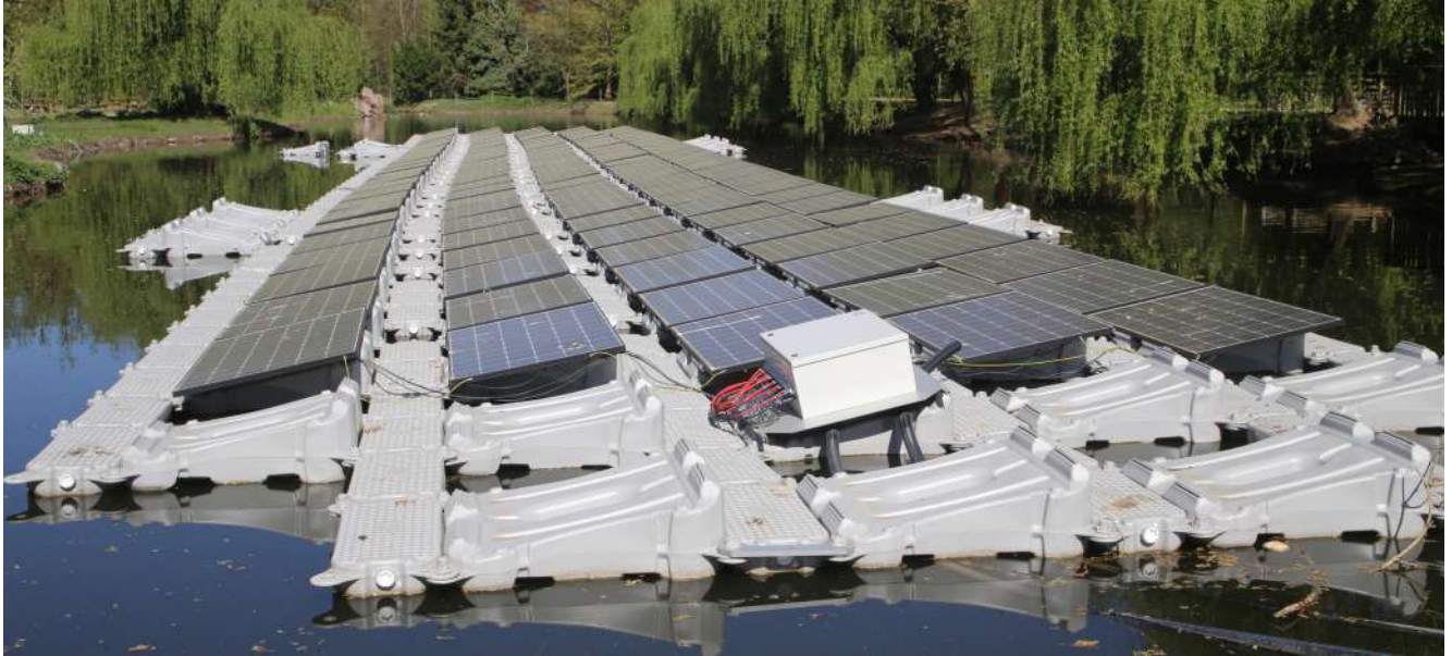
Parc solaire lacustre du Girlenhirsch.

Par la loi n°2023-175 du 10 mars 2023 relative à l'accélération de la production d'énergies renouvelables, l'État a souhaité que soient identifiées au sein de chaque commune des « zones d'accélération des énergies renouvelables » (ZAER), afin de traduire les objectifs de transition énergétique dans une dynamique de planification locale.