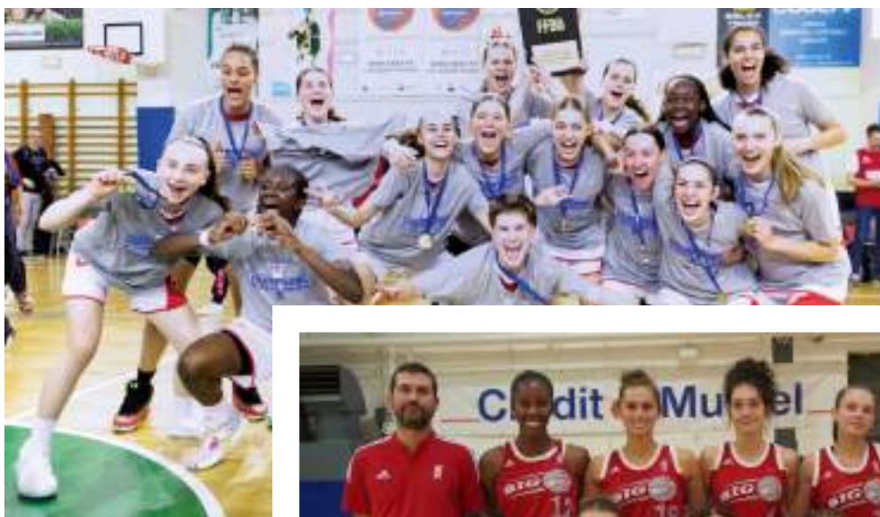
L'équipe des U15

Les familles se sont réunies autour d'un apéritif suivi de grillades/salades, et desserts où chacun apporte quelque chose à partager. Des jeux étaient prévus pour les enfants. Les Fêtes des Voisins sont toujours de beaux moments de convivialité : des rendez-vous renouvelés chaque année au mois de juin, ici et là à Illkirch-Graffenstaden ! Une sympathique occasion également pour Monsieur le Maire, d'aller saluer les habitants de notre ville.