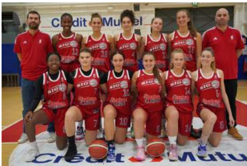
L'équipe féminine Espoir

Coup de chapeau à la SIG qui a réalisé une saison remarquable. Les joueuses évoluant en U15 sont championnes de France tandis que l'équipe féminine espoir monte en Nationale2!