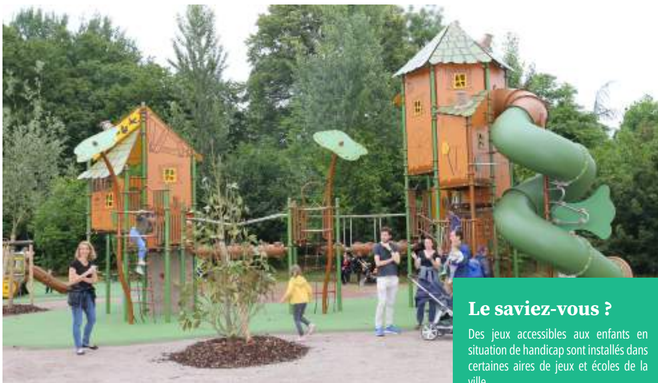
Aire de jeux de la zone de loisirs du Girlenhirsch

Avec l'arrivée des beaux jours, les 44 aires de jeux que compte la ville feront une nouvelle fois le bonheur des enfants qui viendront profiter des différentes structures de jeu à leur disposition. Qu'il s'agisse d'équipements à l'attention de tout petits, d'enfants ou d'adolescents, tous nécessitent un entretien rigoureux.