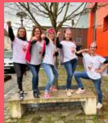
À l'école maternelle Sud

Depuis la rentrée 2020, chaque classe d'école maternelle illkirchoise bénéficie de la présence et de l'accompagnement d'un Agent Territorial Spécialisé des Ecoles Maternelles. Ainsi, aujourd'hui, la Ville compte 38 ATSEM, dont cinq apprenties.