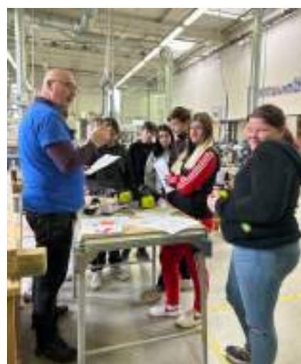
Atelier Prévention des risques liés au bruit