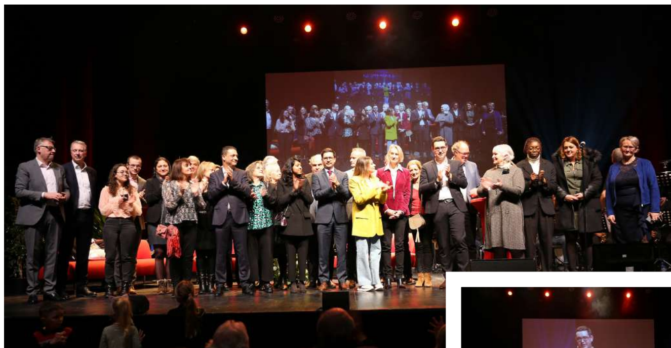
Les Illkirchois mis à l'honneur entourés de l'équipe municipale.

Les Illkirchois et les élus, privés de cérémonie de vœux durant deux ans, ont enfin pu renouer avec ce moment d'échange et de partage. Aussi, c'est avec une impatience et une joie non dissimulées qu'il se sont retrouvés à L'illiade le 12 janvier dernier.